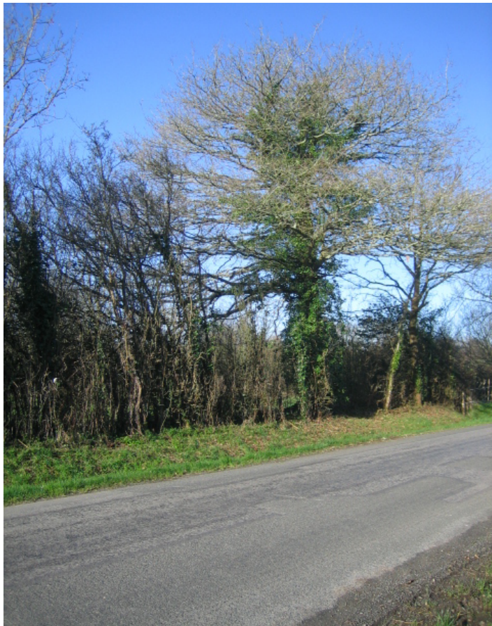
M ↑ - arbre à Grand Capricorne au bord de la route de Notre-Dame vers l'ouest, et détail ↗