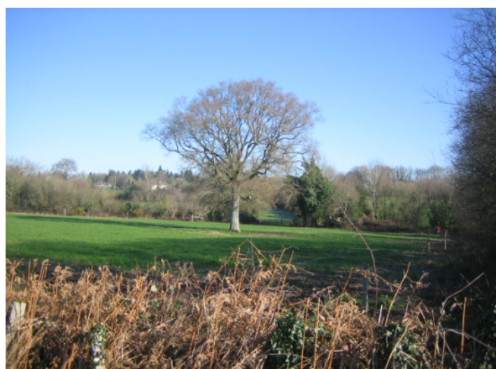
L ↑ - vue de la route de Notre-Dame vers le nord-est. L'arbre avec le lierre au fond abriterait des Grands Capricornes.