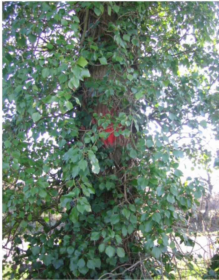
N ↓ - autre arbre à Capricorne vu de la route de Notre-Dame vers le sud-ouest et détail ↙