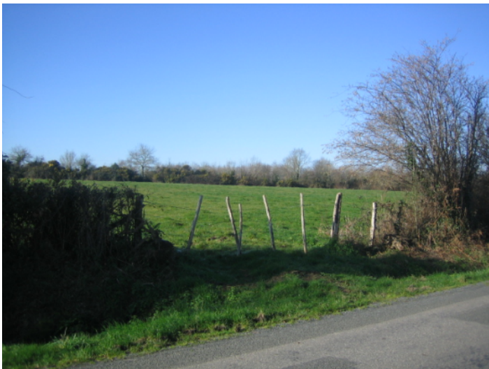
K ↑ - vue de la route de Notre-Dame vers l'ouest.