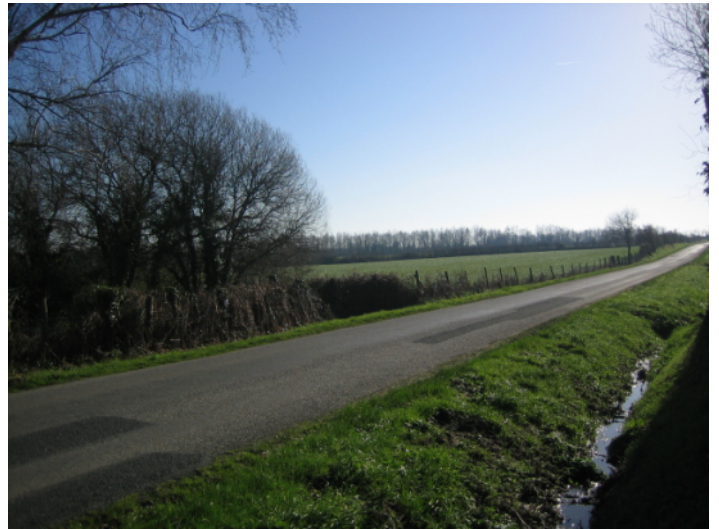
J ↑ - vue de la route de Notre-Dame vers l'est.