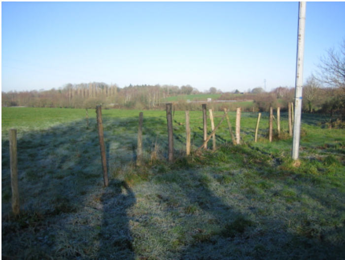
I ↑ - vue de la Pichonnière vers le nord-ouest.