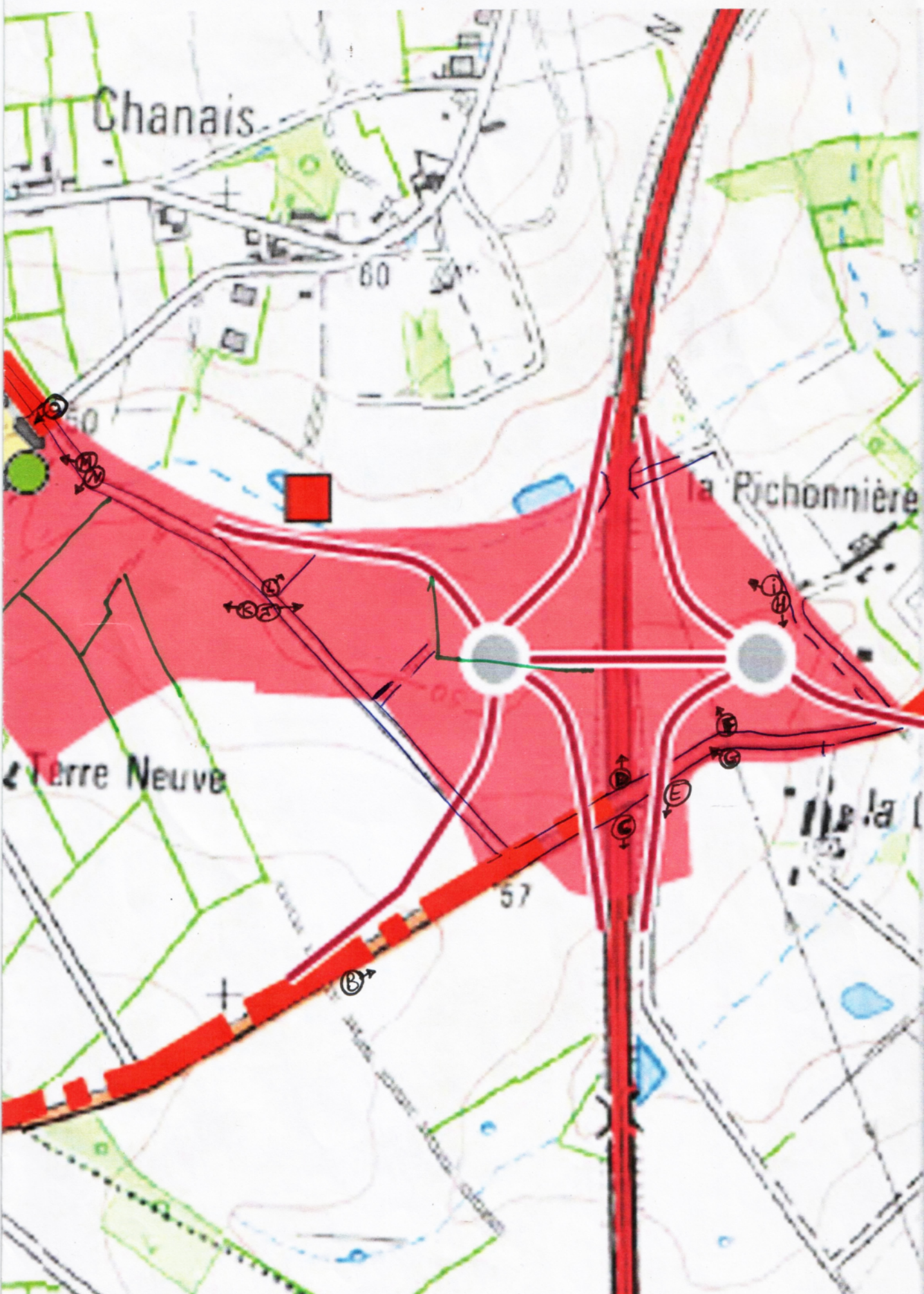
Tracé de l'échangeur est, côté N 137 (Nantes-Rennes) - carte