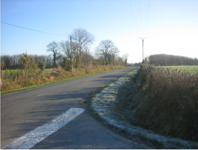
A ↑ - vue de la D 326 (La Paquelais-Grandchamps) vers l'est au niveau du croisement avec la route allant à Treillières.