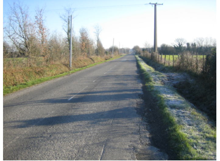
B ↑ - vue de la D 326 (La Paquelais-Grandchamps) vers l'est après le croisement avec la route allant à Terre Neuve.