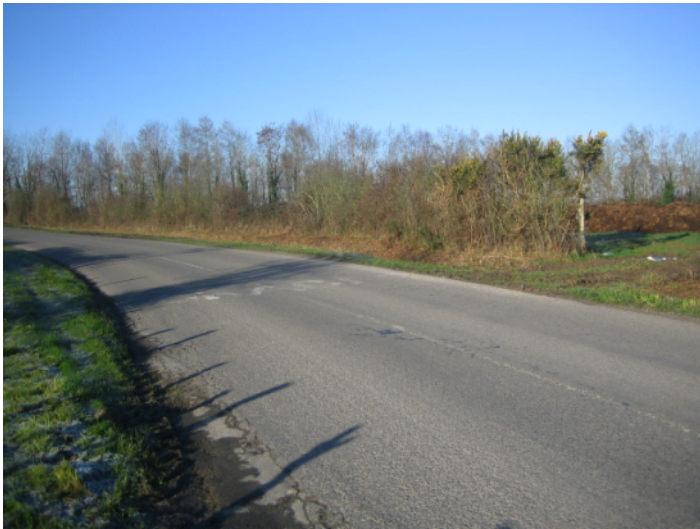
G ↑ - vue depuis la D326 vers nord-est, côté est de pont au-dessus de la N137.