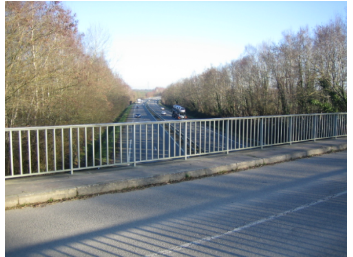
D ↑ - vue du pont de la D326 au dessus de la N137 vers le nord. Les arbres seraient coupés.