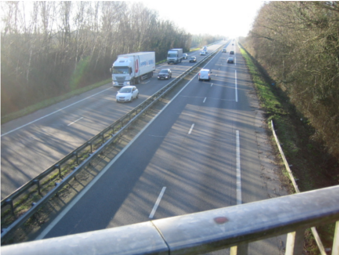
C ↑ - vue du pont de la D326 au dessus de la N137 vers le sud. Les arbres seraient coupés.