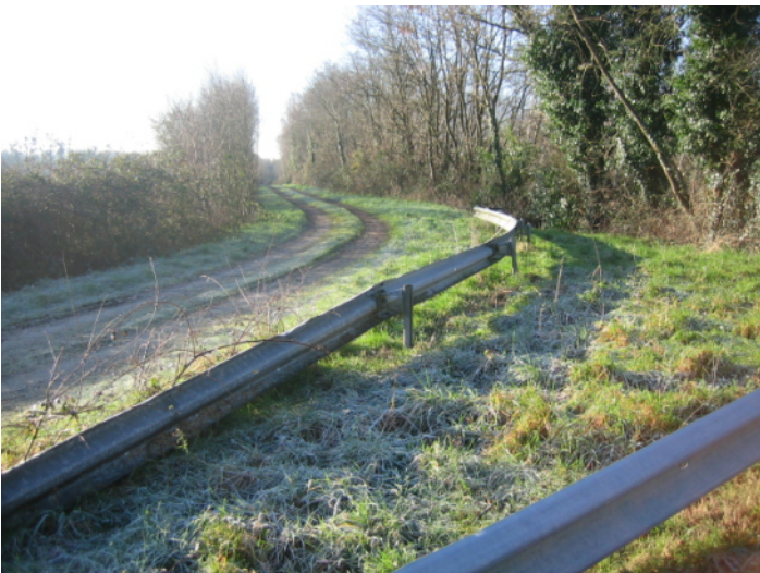
E ↑ - chemin longeant la N137 au sud-est du pont, vue de la D326.