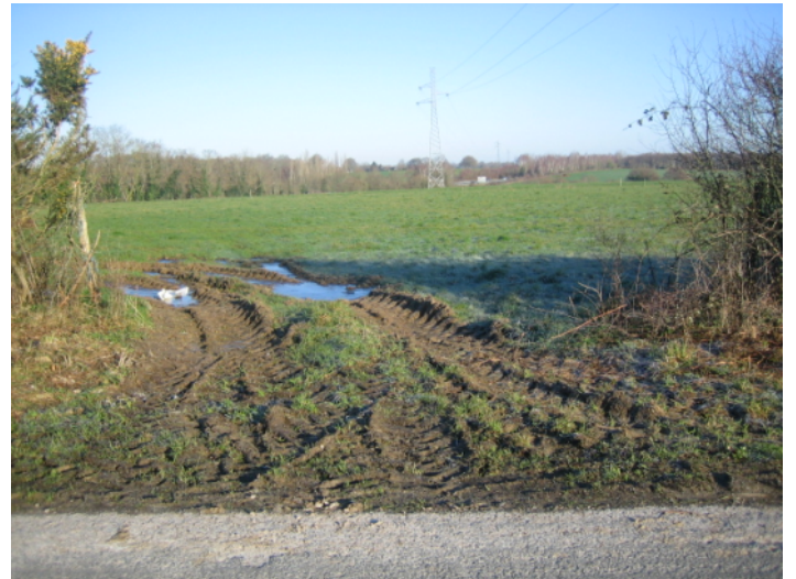
F ↑ - entrée de champ au nord-ouest du pont, vue de la D326